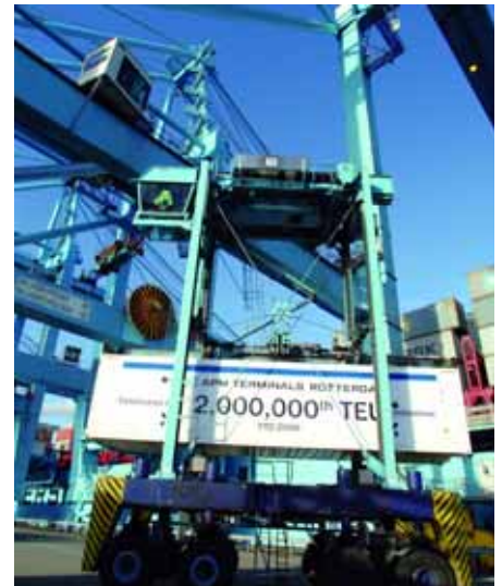
Boom-Port: Der Containerhafen in Rotterdam.