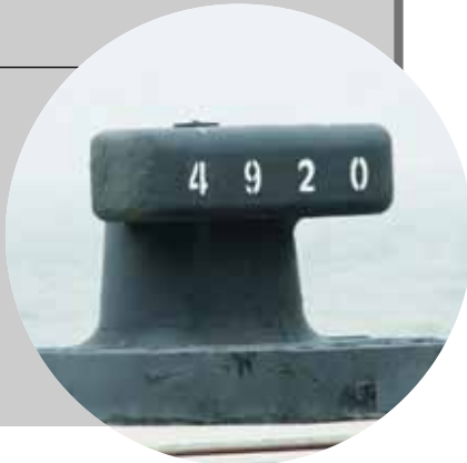
Maersk, sk, js

Nach 4920 m endet die längste Stromkaje der Welt und mit ihr das Bundesland Bremen.